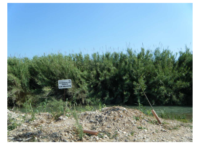
PUENTE SOBRE EL CORDEL DE LÍRIA