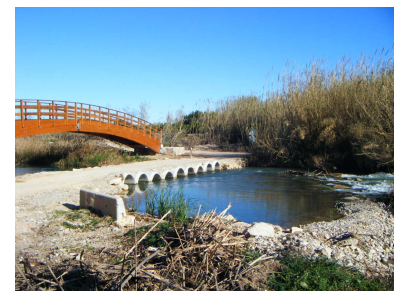
CAMINO INSTITUTO NUEVO